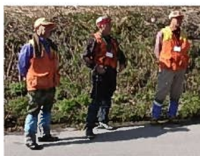
地元ハンターの方々