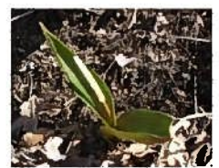
開花を待つカタクリ