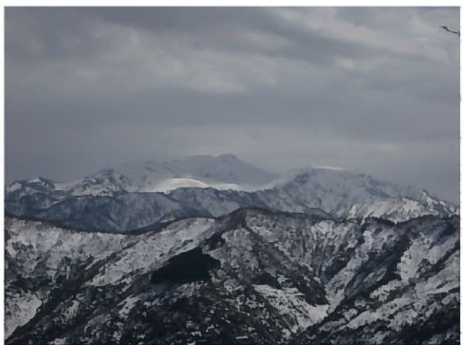
山頂付近から見た霊峰白山