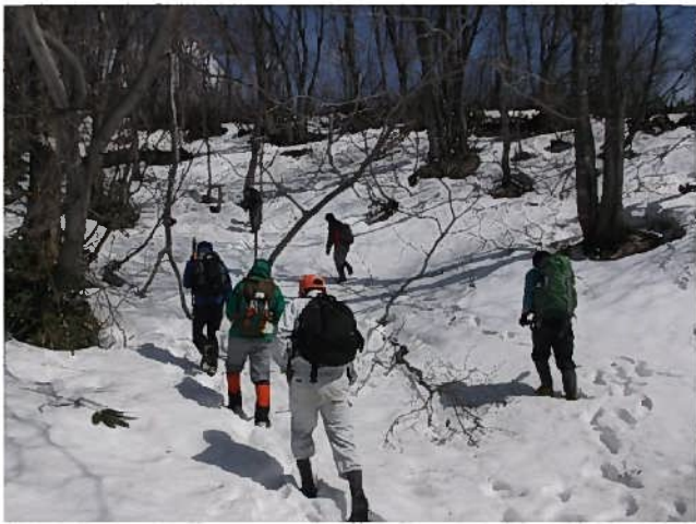
山頂を目指す参加者