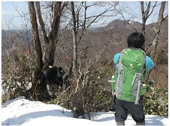
山頂付近で熊を探す参加者