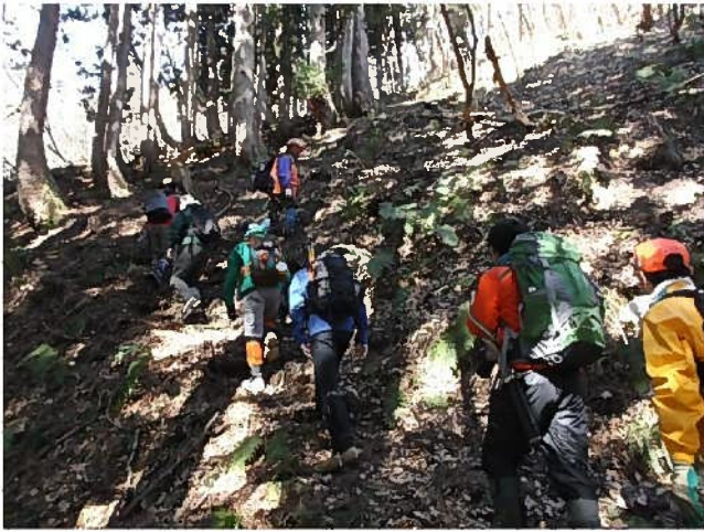
急斜面を登山する参加者