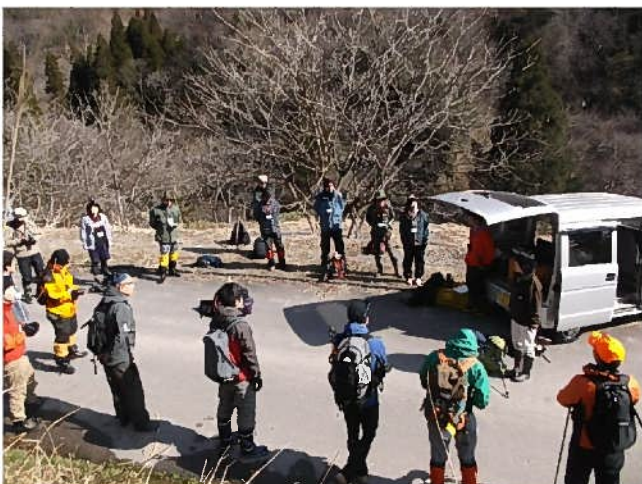
開催とスケジュール説明の状況