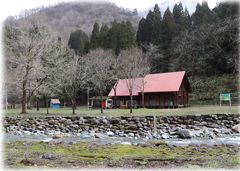
瀬波川キャンプ場 平成 31 年 4 月 1 日撮影